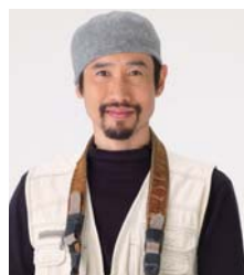
審査員 カメラマン 渡部陽一氏 ほか

例 家族の団らん、パパの育児、3世代同居家族の様子、親子で一緒に楽しみながら何かに取り組んでいる日常の様子 (食事作り、動植物の世話、楽器・スポーツの練習、語らいなど)、出産を控える家族で準備している様子等、子育て家族の絆やあたたかさ、ほほえましさを表しているもの