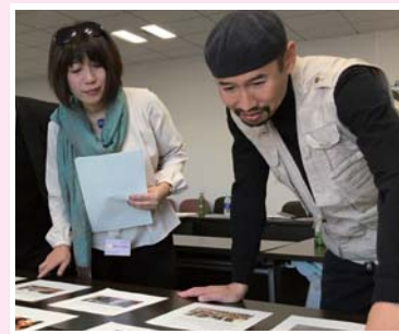
◀ 応募作品の審査の様子 (写真部門)