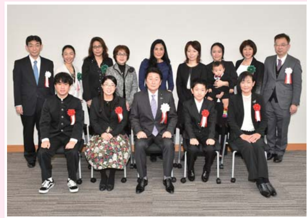
▲ 松山少子化担当大臣による表彰後の記念撮影